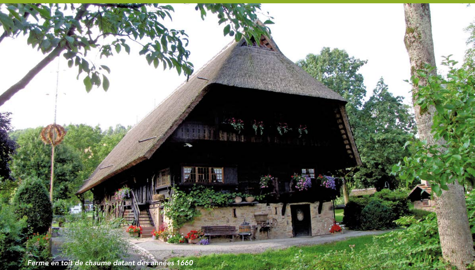
Ferme en toit de chaume datant des années 1660