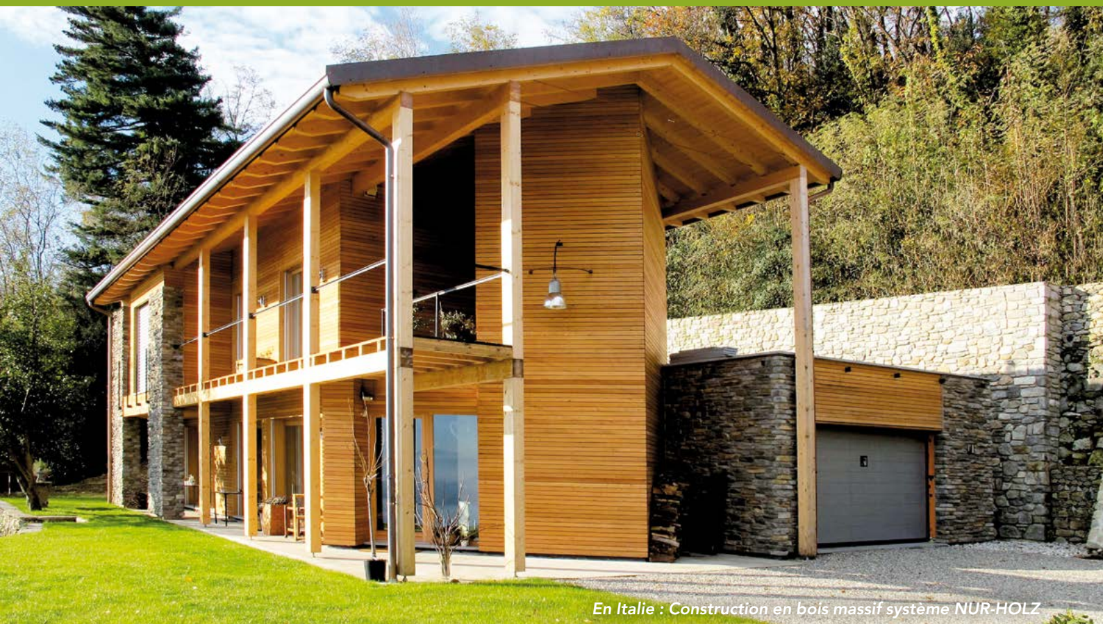
En Italie : Construction en bois massif système NUR-HOLZ