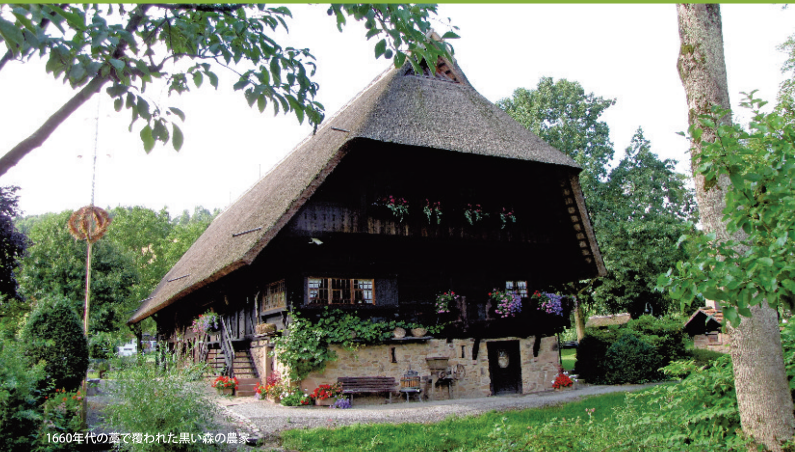
1660年代の藁で覆われた黒い森の農家