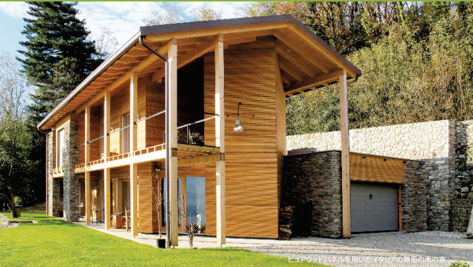
ピュアウッドパネルを用いたイタリアの無垢の木の家